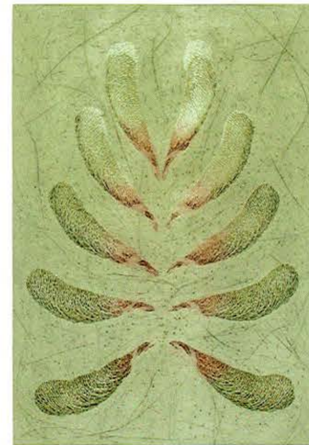
Bosque íntimo , 2015 • Grabado en xilografía, ácido directo y punta seca sobre papel Super Alfa de Guarro Casas de 250 gr • 109 x 71 cm

En abril de 2016 presentó su primera exposición individual, Morada interior , en el Museo Güelu, en la ciudad de Cuernavaca. La muestra reunió obra gráfica, pintura y arte objeto. Tanto los visitantes como la crítica constataron los avances de su trabajo y la reafirmación de su lenguaje, con el que a partir de formas sencillas construye elementos que ofrecen múltiples lecturas al espectador.