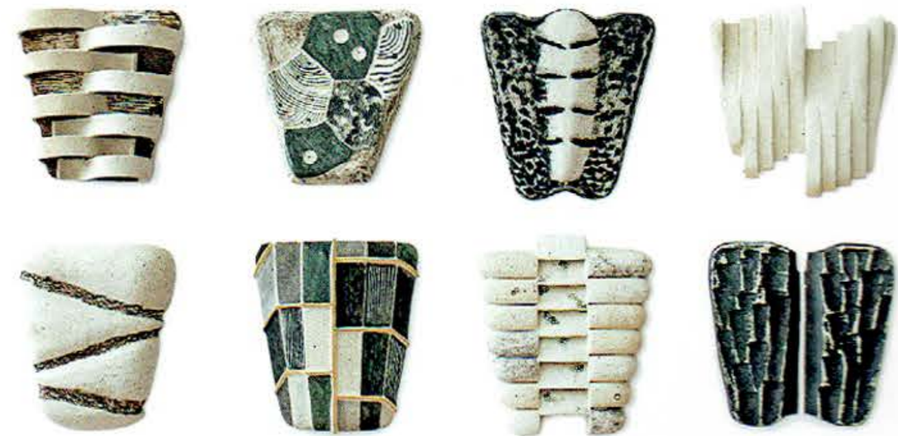
Corseletes , 2015 • Serie "Corseletes" • Fragmento • Barro de Zocotecas con engobes y óxidos • 25 x 28 cm c/u