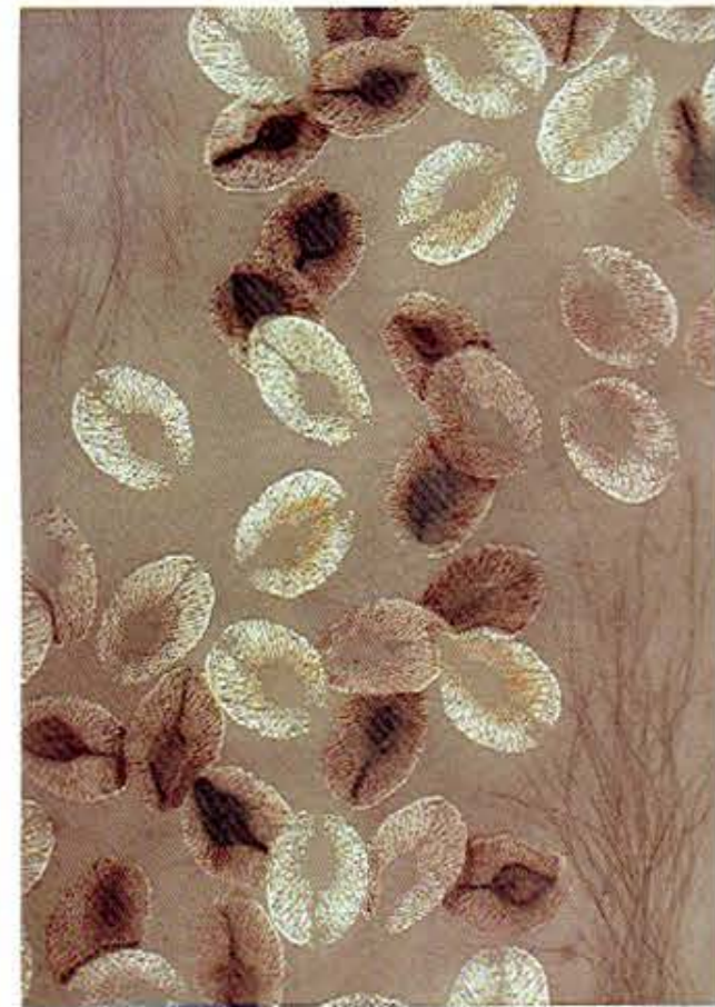
Camino a casa , 2015 • Grabado en xilografía, ácido directo y punta seca sobre papel Super Alfa de Guarro Casas de 250 gr • 109 x 71 cm